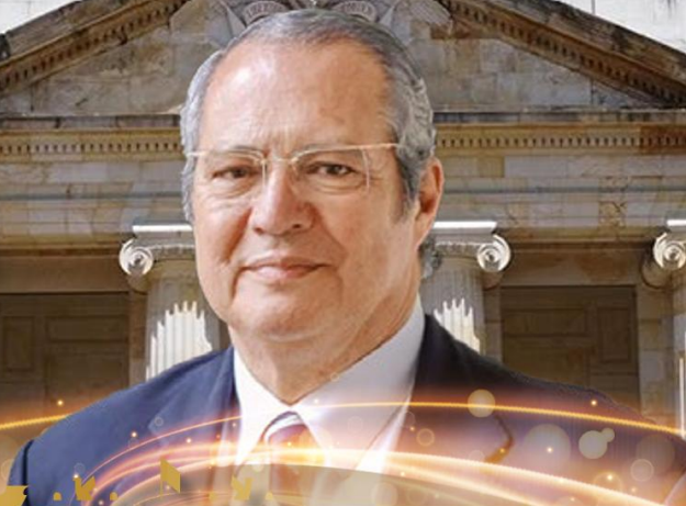
Iván Leonidas Name Vásquez Presidente del Senado de la República