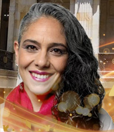
María José Pizarro Rodríguez Primera Vicepresidenta