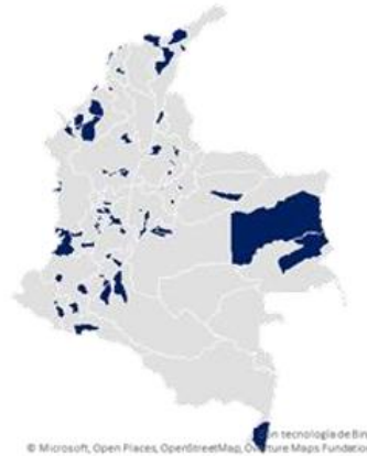
Ilustración 1. Distribución territorial de los beneficiarios

Las intervenciones en el sector se han llevado a cabo a través de diferentes instrumentos: asistencia técnica (55,7 %), formación (24,6 %), cofinanciación (13,8 %), acceso a herramientas digitales (4,8 %) y vouchers (1,2 %). Asimismo, el 55,4 % se han realizado en empresas lideradas por mujeres y propiedad de una mujer [1].